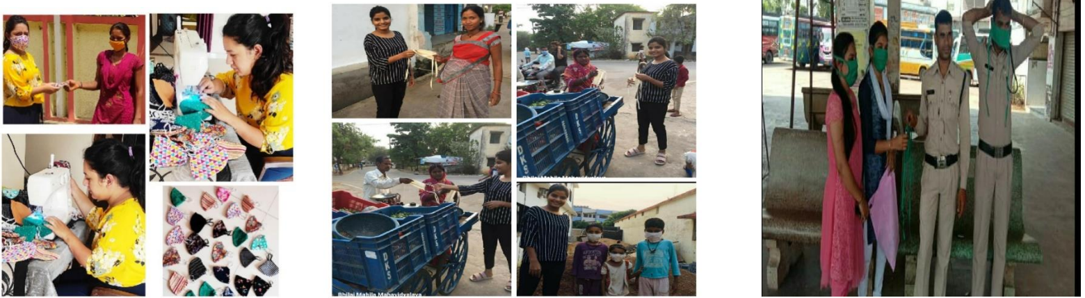
Home Science Staff training the attendants to stitch masks.